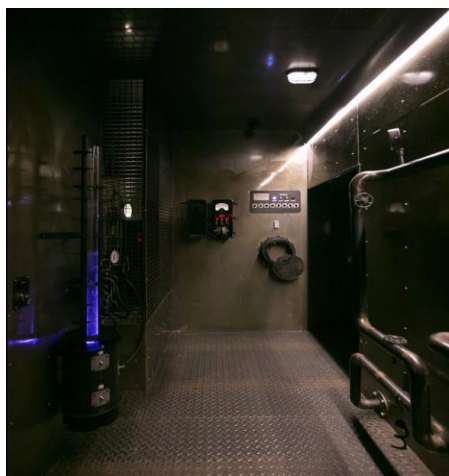
Obr. 2 Úniková hra inspirována Titanicem [10]