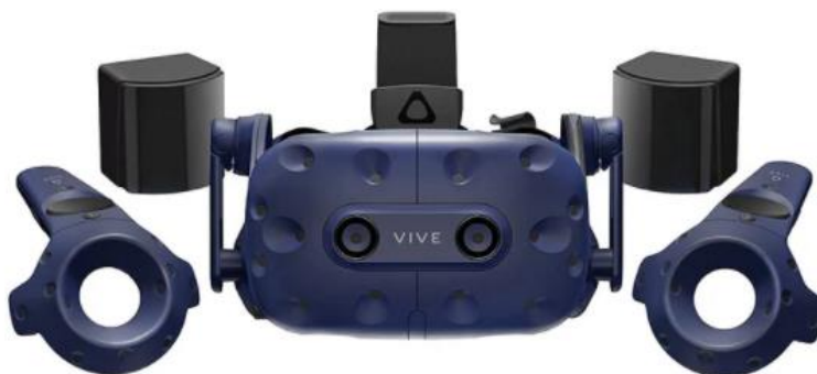
Obr. 1 Headset, senzory pro pohyb hlavy a ovladače

VR prostředí. Díky nim je také možné uchopit, přenášet nebo házet jednotlivé objekty či předměty. Ovládací prvky ovladačů je možné využít i k dalším interakcím ve VR prostředí – teleportace, otevírání dveří, použití ukazovátka a další. Obrázek 1 poukazuje na technologii VR [7].