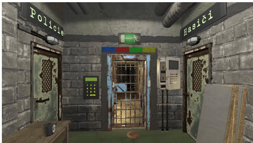
Obr. 4 Hlavní místnost

Klíčovým prvkem v „Hlavní místnosti“ (Obrázek 4) je osvojení si a využívání funkcí VR. Mezi ty patří především teleportace, uchopení, přenos nebo manipulace s interaktivními předměty. Druhý pohled na tuto místnost je směřován především na schopnost reagovat při volání na tísňové linky. Vzhledem k tomuto prvku a vývoji hry zde dochází k jistému tlaku na hráče a jeho chování ve stresových situacích a jeho reagování na danou situaci.